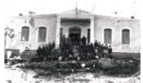
Το σχολείο στα παλιά χρόνια

Δυστυχώς, το 1964 τα ελληνικά σχολεία έκλεισαν οριστικά στο νησί και μόνο κρυφά γίνοντουσαν