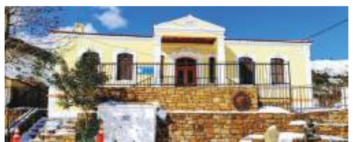
Το δημοτικό σχολείο σήμερα!