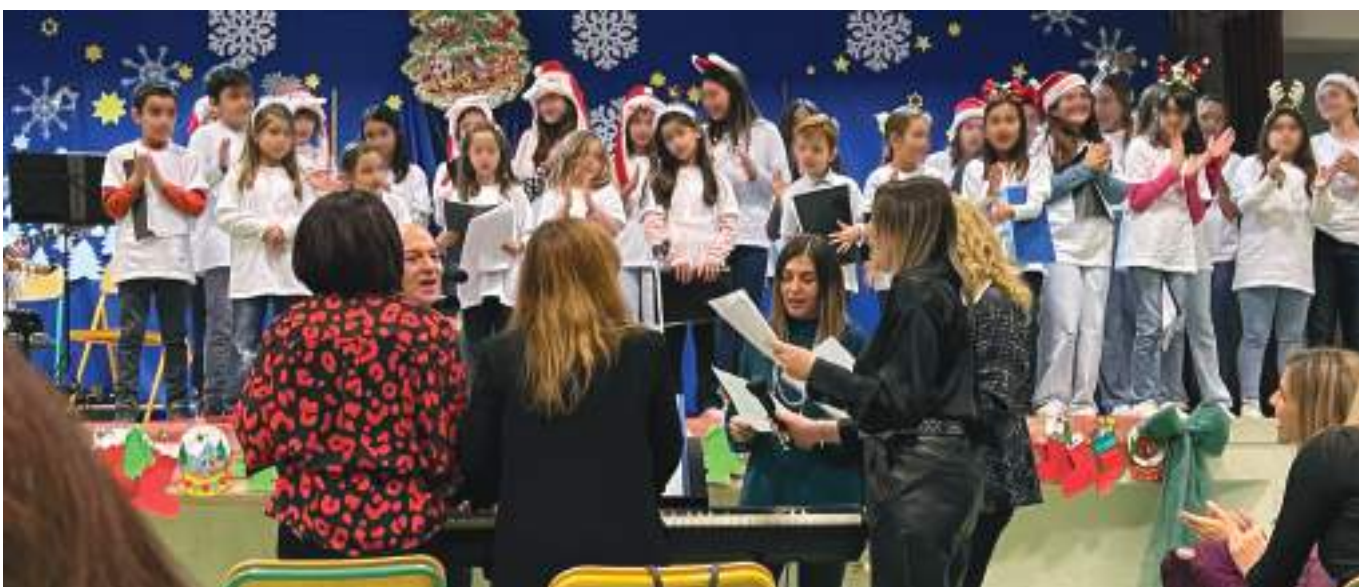
Οι δασκάλες και ο διευθυντής του σχολείου μας τραγουδούν τα Κάλαντα της Χίου