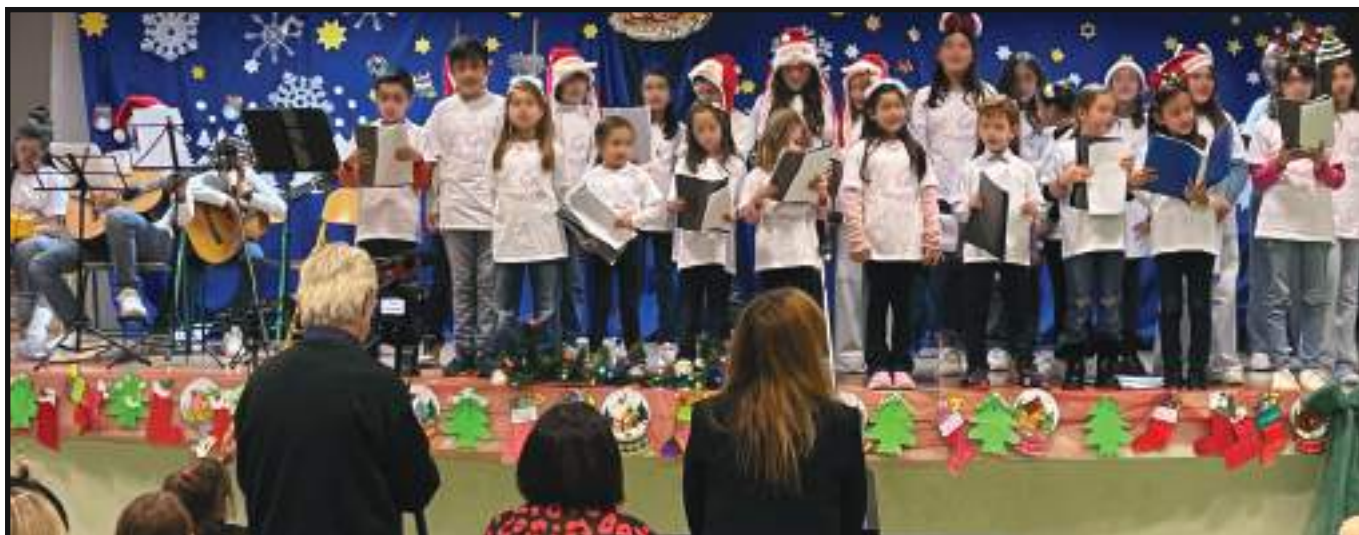
Οι μαθητές και οι μαθήτριες της χορωδίας μας τραγουδούν παραδοσιακά Κάλαντα .