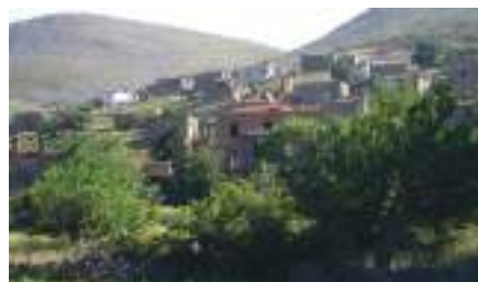
Το χωριό Σχοινούδι σήμερα

τη σχολική ποδιά της, κρατούσε τη σάκα στο χέρι, μαλλιά μαζεμένα και πάντα με φούστα, τότε τα κορίτσια δεν φορούσαν παντελόνια!