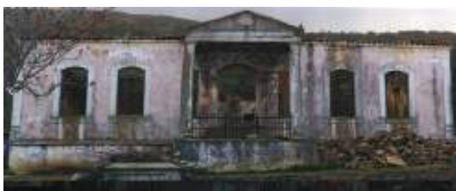
Το όμορφο κτήριο έκλεισε κι ερημώθηκε.